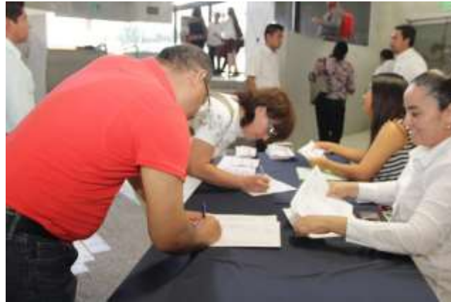
Asistente al Foro