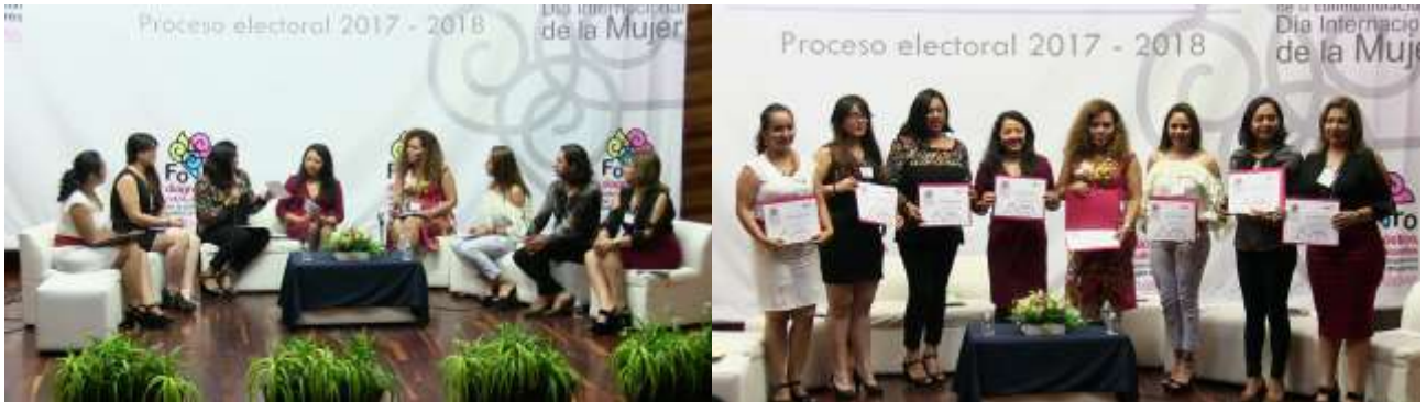
Representantes de los partidos políticos acreditados ante el Instituto de Elecciones y Participación Ciudadana