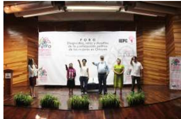
Toma de protesta