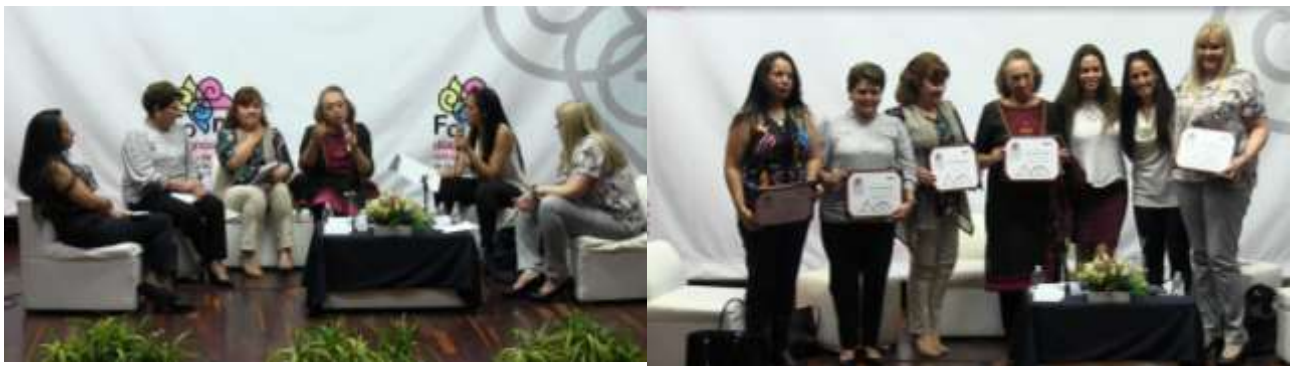
Mujeres destacadas en la política chiapaneca