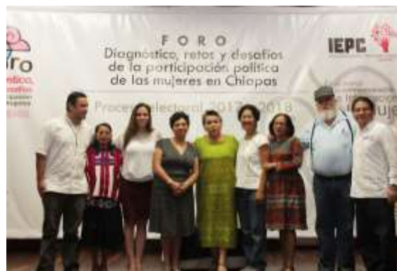
Integrantes de la Comisión Provisional de Equidad de Género y No Discriminación y grupo de trabajo del Observatorio de la Participación y Empoderamiento Político de las Mujeres