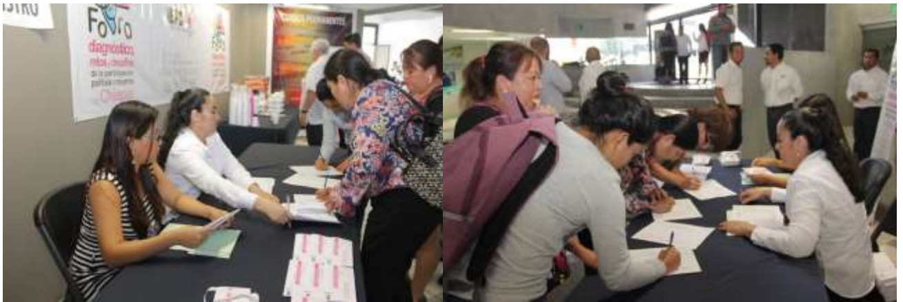
Asistente al Foro